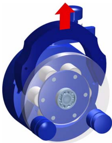
2. Schlauchkassette entnehmen