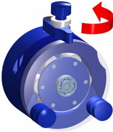
1. Schwenkhebel öffnen